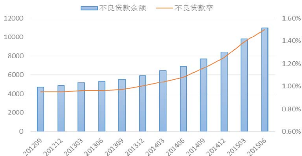
图2：中国商业银行不良贷款余额及比例

长的趋势可能延续到未来一两年。需要利用好政策支持和银行自身定价能力的提升做好贷款发放平稳运行，并使资产质量处于可控范围。